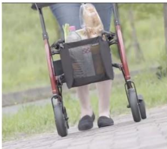
傾いた道でも、ハンドルを取られることなく安定して進めます