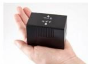
コンパクトなバッテリー