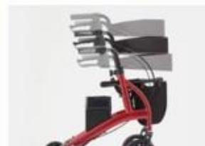
ハンドル高さ6段階調節可