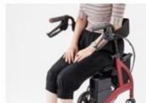
疲れたら座って休憩