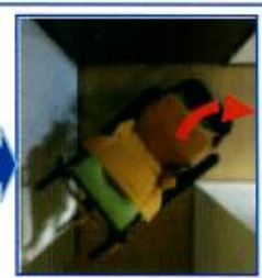
マイチルト・コンパクト

在宅用に設計されたスリム&コンパクトサイズ。 居室内の移動もスムーズにできるようになりました。