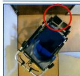
従来のマイチルト