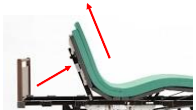
腹部圧迫軽減マットレス

2層になったマットレスが上方にのびるので、背上げ時のずれや腹部への圧迫感が軽減されます。