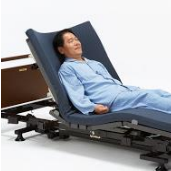
座位が安定するサイドアップ機能

麻痺のある方や座位が不安定な方に最適です。背上げ時の座位が安定します。大柄な方でも快適な97cm幅を展示しています。